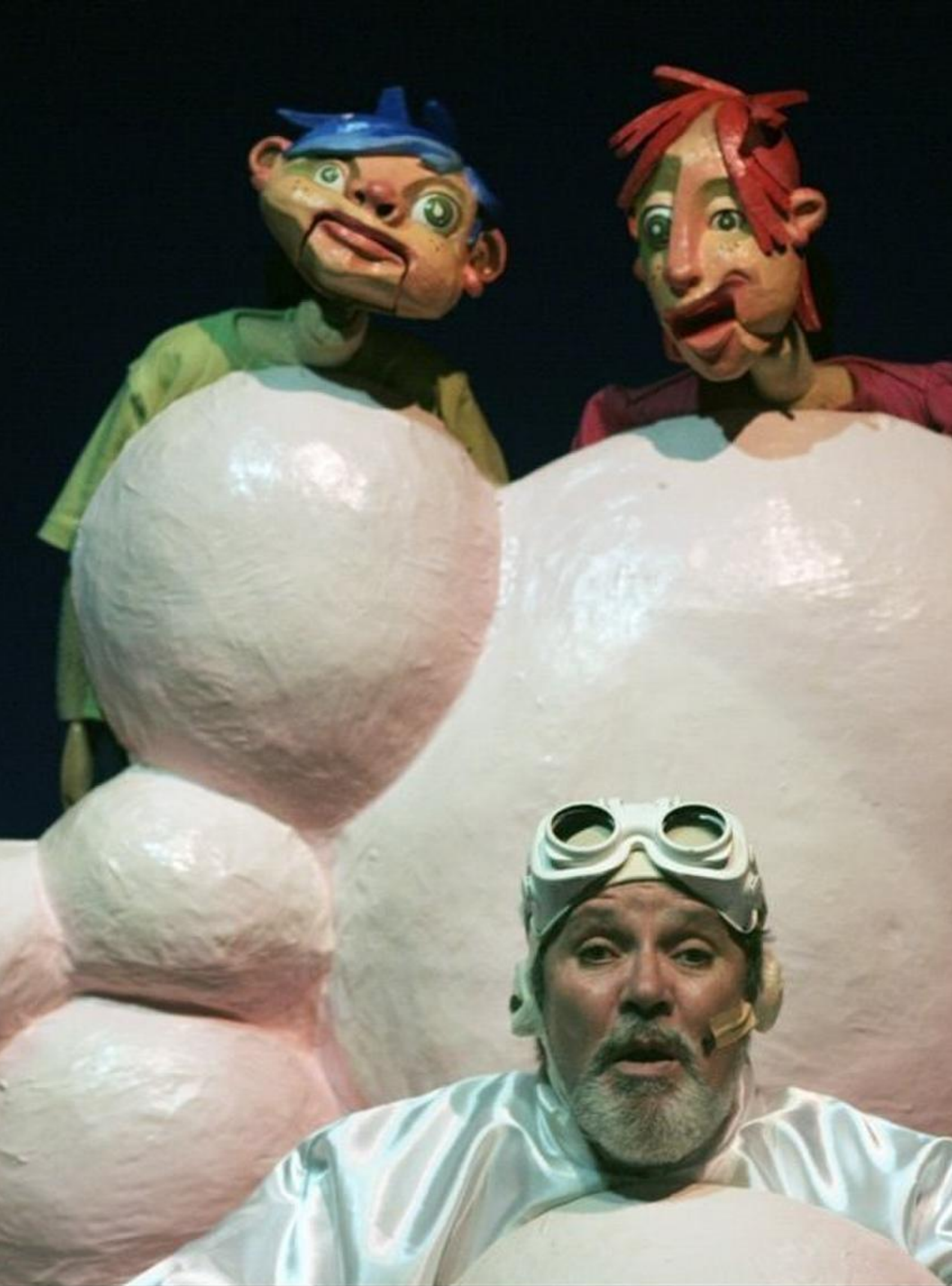
· ANDAR NAS NUVENS · Fotografia de Eduardo Arau