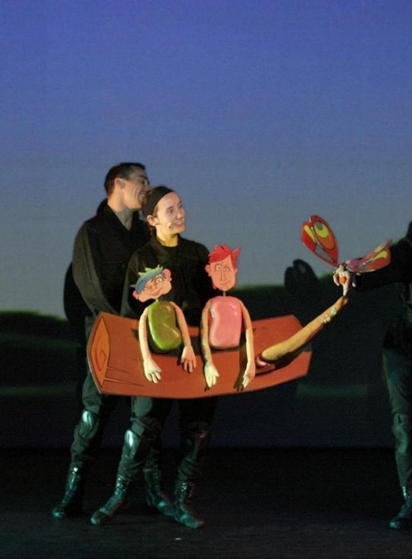
• ANDAR NAS NUVENS •