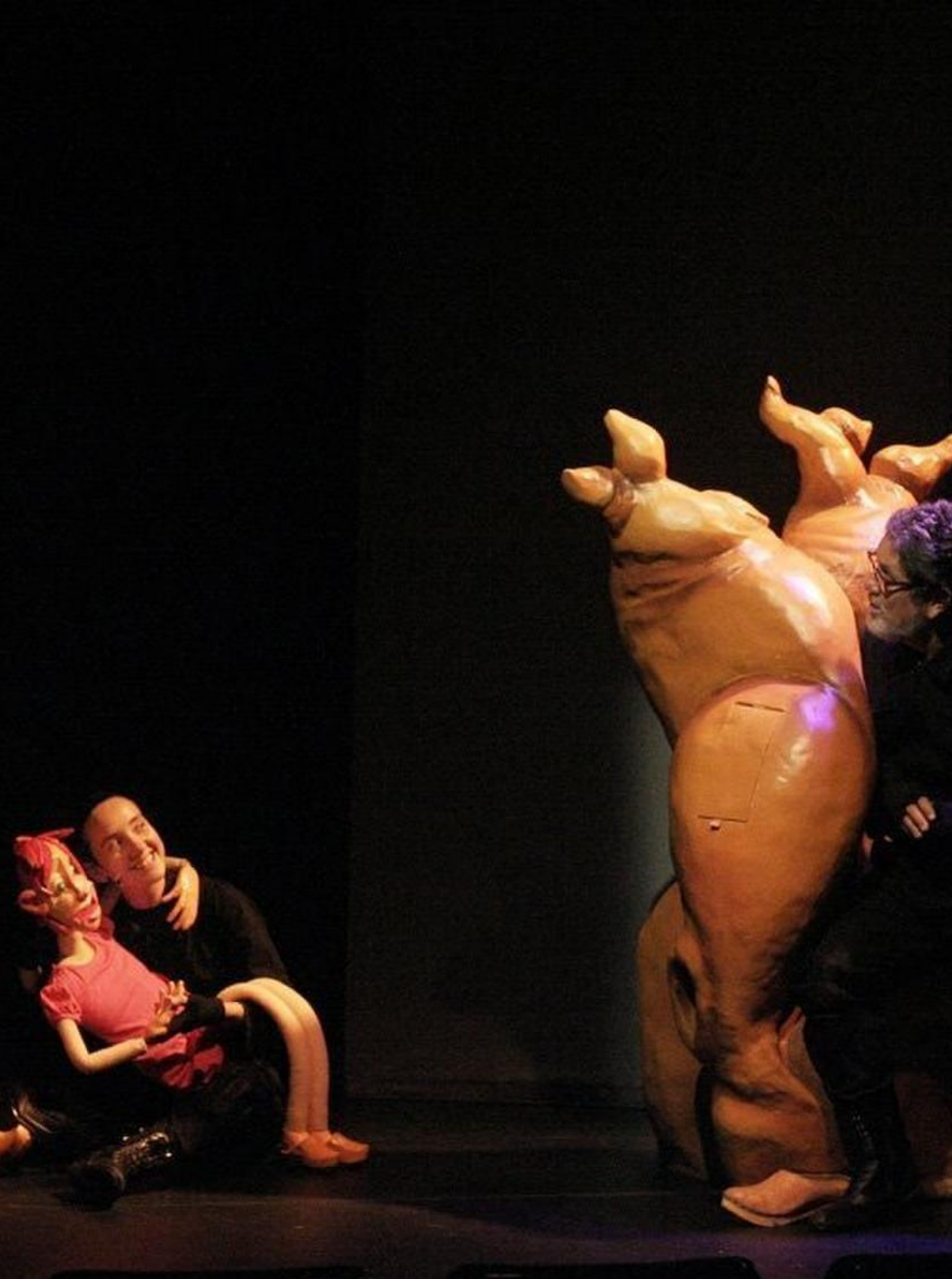
T · ANDAR NAS NUVENS