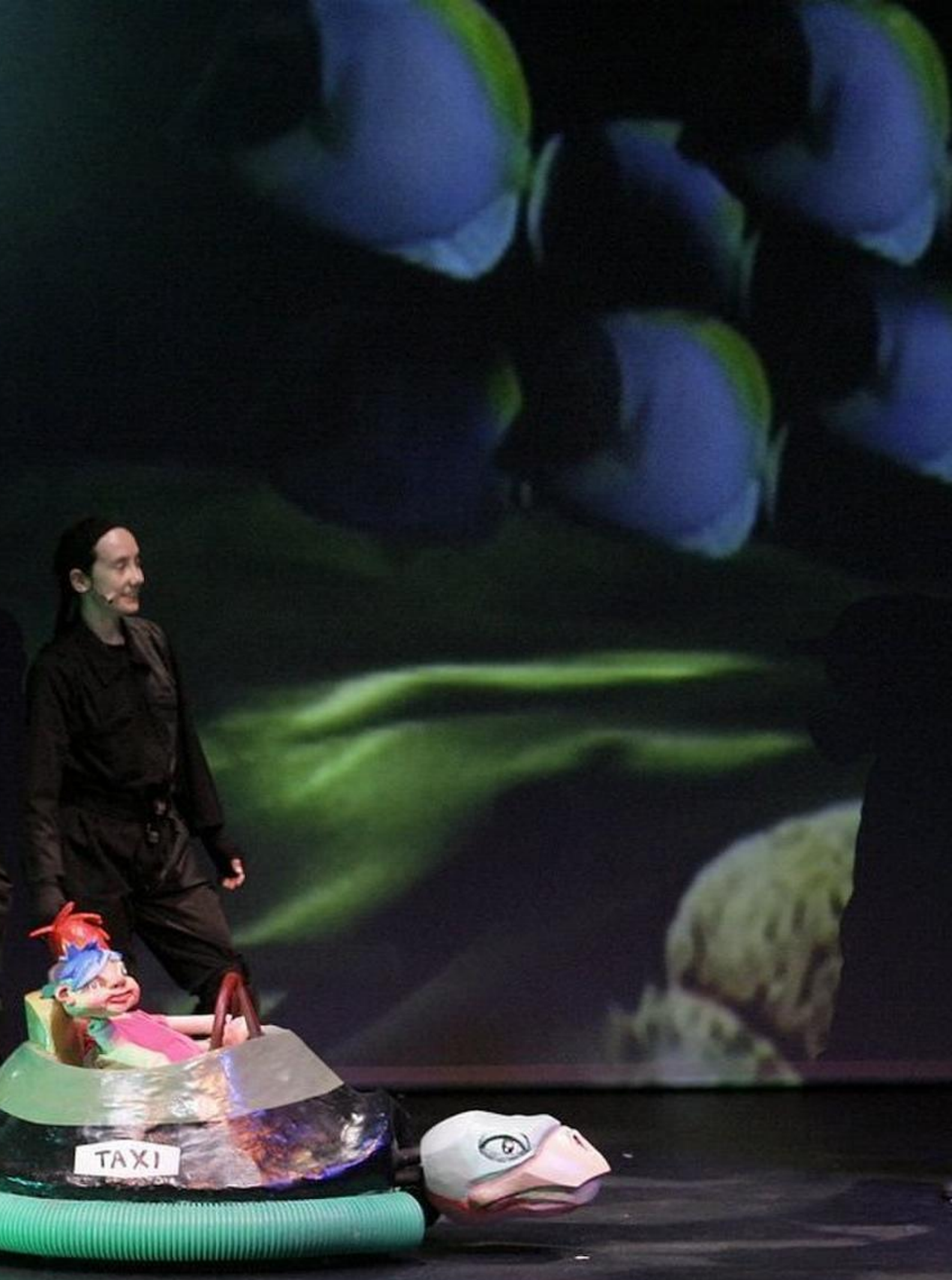
T · ANDAR NAS NUVENS · Fotografia de Eduardo Araújo